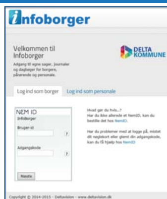
Login til Infoborger - via NemID

Det er fagsystemerne der indeholder borgerdata og det er derfor disse systemer, der er ansvarlige for at levere de, for en givet person, relevante oplysninger.